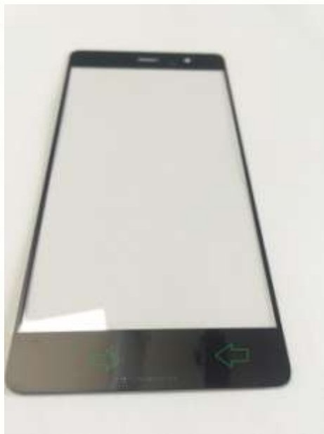
样品 1：绿色箭头所指的位置有丙烯酸树脂污染

下面是 2 个手机玻璃样品，边框表面已有丝印油墨。用德国 SITA 清洁度仪测试边框部位，只需要十几秒即可得出数据。读数越高表示污染越严重，单位为 RFU，即相对荧光单位。